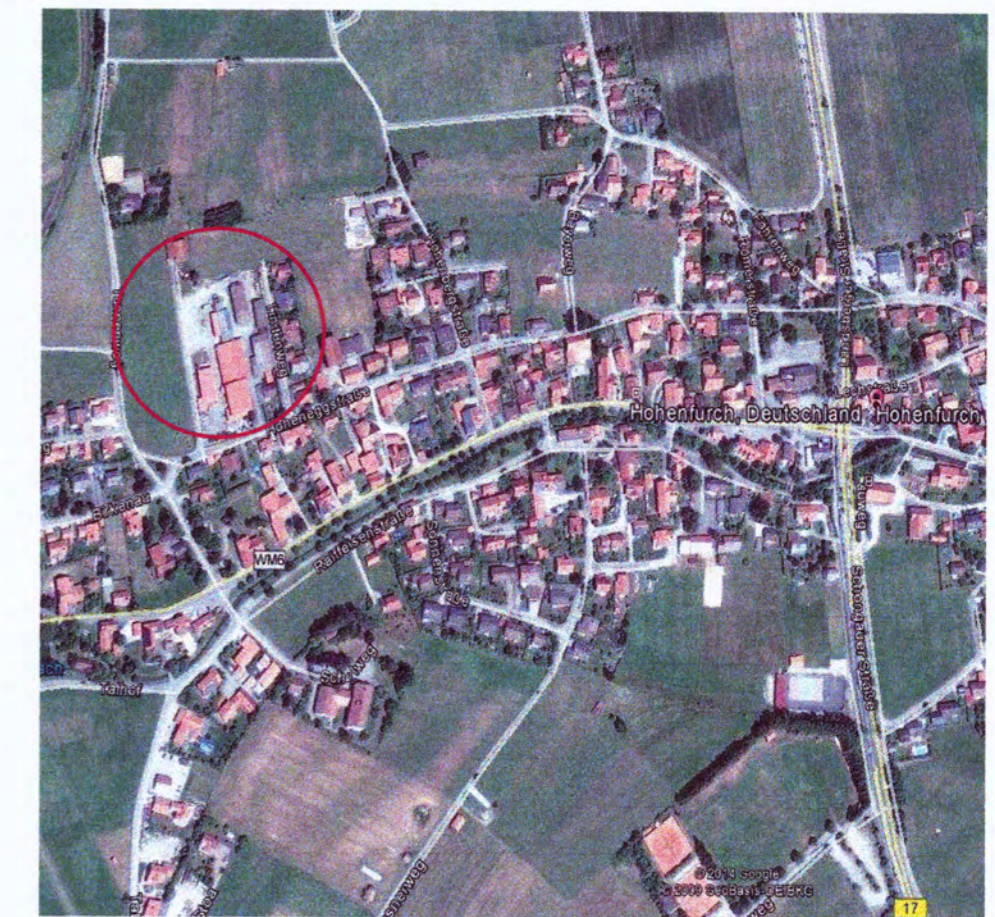
Ausschnitt Luftbild unmaßstäblich

Gemeinde Hohenfurch Landkreis Weilheim - Schongau 9. ÄNDERUNG