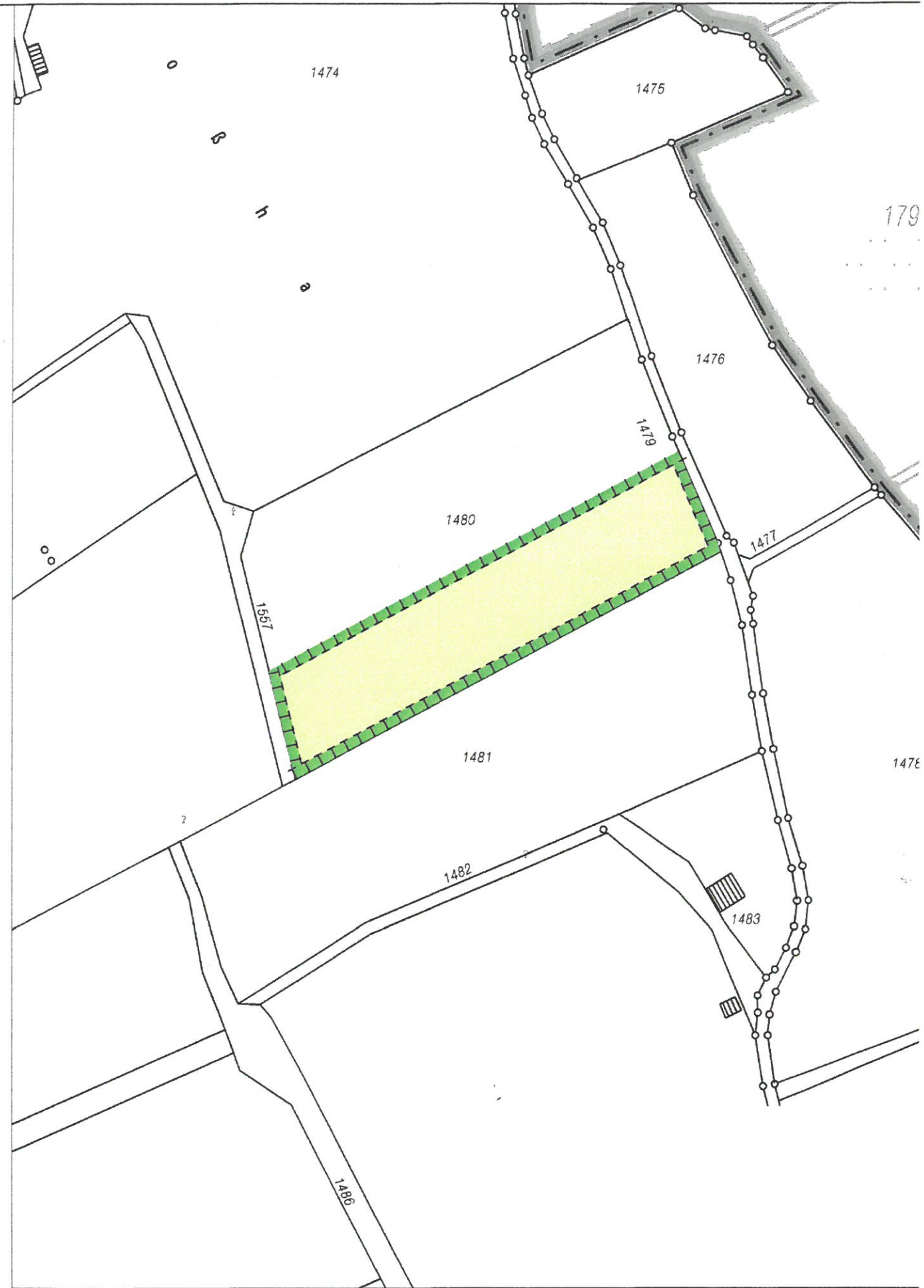
2. Flurnummer 1480, Gemarkg. Schwabniederhofen, extern Ausgleichsfläche, (Geltungsbereich B)