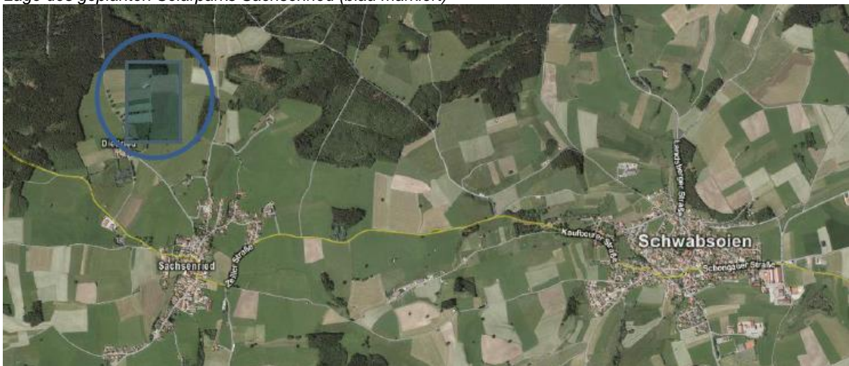
Lage des geplanten Solarparks Sachsenried (blau markiert)

Der räumliche Geltungsbereich des vorhabenbezogenen Bebauungsplanes „Solarpark Sachsenried“ ergibt sich aus der Planzeichnung. Für die Abgrenzung bzw. räumliche Aufteilung des Geltungsbereiches gilt der Lageplan, der wie folgt dargestellt, Bestandteil dieser Bekanntmachung ist: